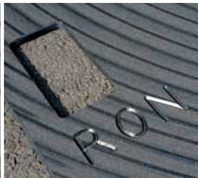
Personalisation Personalisation Personalisatie