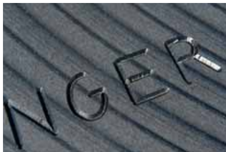
Personalisation Personalisation Personalisatie