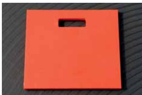
Other colors possible Autre couleurs sur demande Verkrijgbaar in andere kleuren