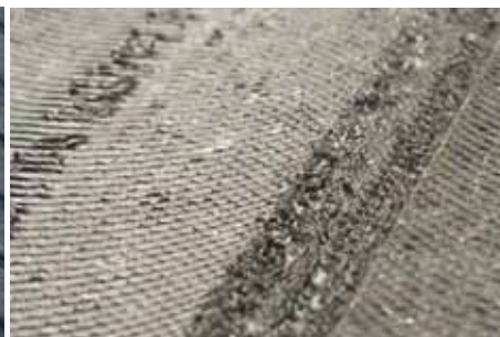
Anti-slip for better grip Finition anti-dérapante Antislip uitvoering