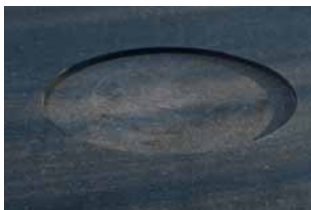
Milled centre for the outrigger foot Usinage centrale pour emplacement de votre stabilisateur Infrezing voor voet