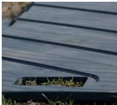
Anti-slip for better grip Power-plates crantés Antislip voor betere grip