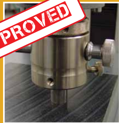
Tested and certified by VKC Institute specialized in testing synthetic materials