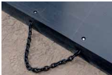
Execution with chains Power-Pads avec chaines Power-pads met kettingen